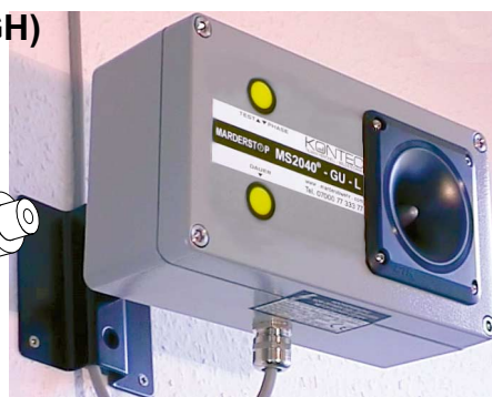
Abb. 6: z.B. MS2040GU-L (KGH)