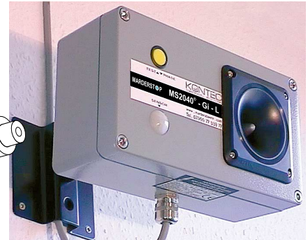
Abb. 3: z.B. MS2040Gi-L (KGH)