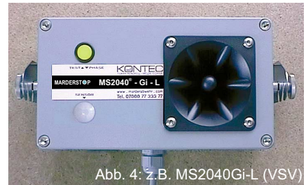
Abb. 4: z.B. MS2040Gi-L (VSV)