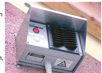
Abb. 6: Wandmontage mit Edelstahl-Haube (MS2040i-L-H)