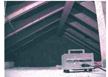
z.B.: N1 scheucht im Dachspitz

Die Geräte bieten eine effiziente Scheuchleistung durch den automatischen Multifrequenz-Betrieb in nur 1 oder sogar 2 Scheuchrichtungen. Durch das interne elektronisch stabilisierte Netzteil wird eine konstante Maximal-Ausgangsleistung erzielt. Die Geräte sind mit Breitstrahlern ausgerüstet, die flächige Schallabstrahlung bewirken, die vorzugsweise in Strahlerrichtung liegt 1) . Das Gerät wird derart ausgerichtet, daß der Einstiegsbereich der Marder oder deren Nistplatz erfaßt wird. Die Standardversion N2 enthält unsere praktische patentierte Aufhänge-Vorrichtung zur schwebenden Installation über der Dachboden-Fläche! Durch die minimale Stromaufnahme der Geräte entstehen bei Betrieb rund um die Uhr kaum nennenswerte Betriebskosten.