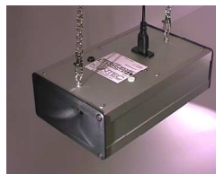
Standgerät (-GF) bzw. Hängeversion von MS2040N2 (2 Scheuchrichtungen)